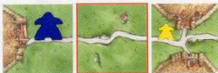
Pouze modrý získá 3 body za cestu.

Každý hráč dostane ke svým 7 figurkám ještě jednu velkou. Tu lze použít stejně jako ostatní figurky. Při bodování však má v příslušné krajině (na cestě, ve městě, na louce) dvojnásobnou hodnotu (počítá se jako 2 figurky). Po vyhodnocení se vrací k hráči a může být použita při příštím tahu. Pokud ji hráč umístí jako sedláka, zůstává na hrací ploše do konce hry jako ostatní sedláci.