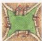
Tato kartička má 4 oddělené části města