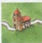
Klášter dělí cestu na dvě části