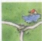
Hostinec leží na pravé části silnice